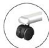
キャスター: ストッパー付き(2個)