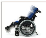
座面角度調節機能