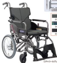
①チャコールグレー