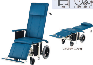
フルリクライニング椅