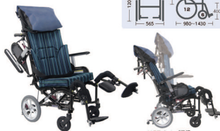
リクライニング機構