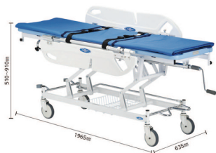
Height Adjustable Stretcher