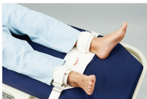
Segufix Stretcher Position System(Foot Strap)