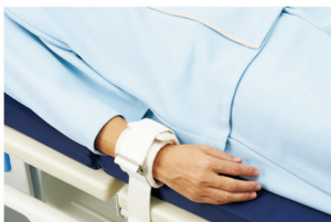
Segufix Stretcher Position System(Hand Strap)