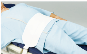
Segufix Stretcher Position System (Shoulder Strap)