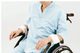
Segufix Chair Belt System (Hand Strap)