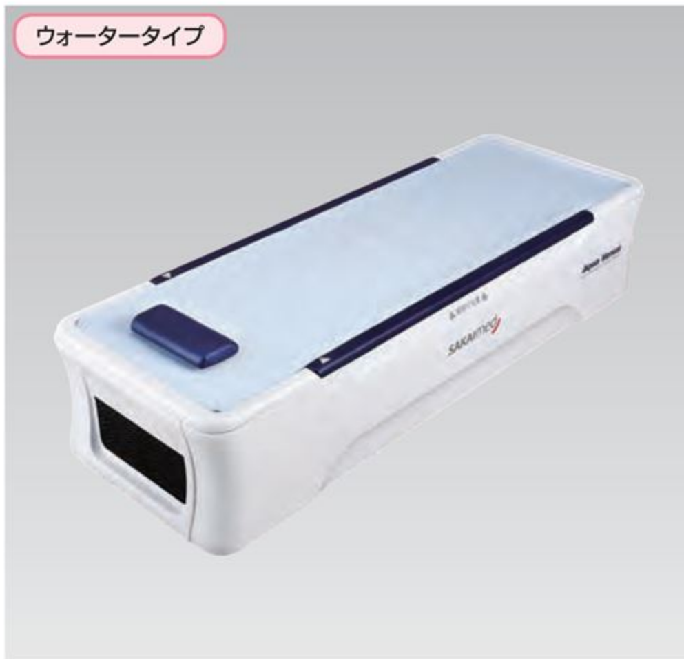
ウォータータイプ