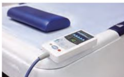
使いやすい操作リモコン

Hydraulic Massage System "AQUABED Prime"