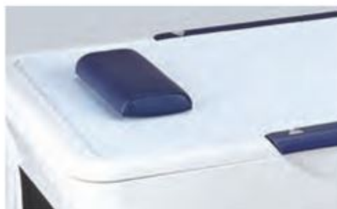
頭部が揺れない消波技術