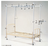
ベッドの取り付け例