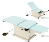
Electric Hydraulic Examination Table