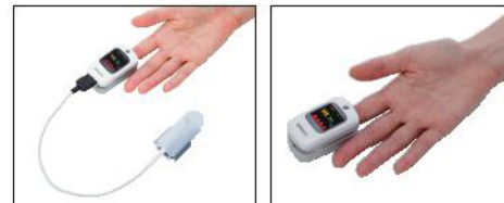
自動認識機能により、プローブを接続したまま本体で測定することもできます