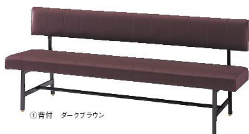
①背付 ダークブラウン