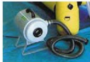
除染ブース用エアープロア(オプション)