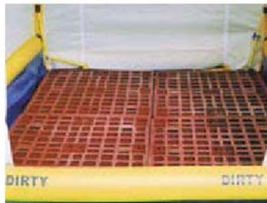
フロアパネル 汚染水に足をつけることなく、除染作業ができます。床下に約700ℓの貯水ができます。