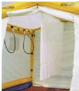
仕切りカーテン ブース内がカーテンにより仕切られ、男女もしくは歩行者とストレッチャー搬送者に分ける事ができます。