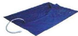
汚染水用ウォータータンク(オプション)