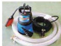
汚染水用ウォーターポンプ(オプション)